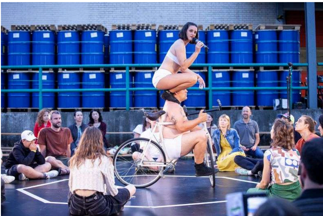
Korespondance Praha 2024, Alta Gama (ES): Mentir lo Mínimo