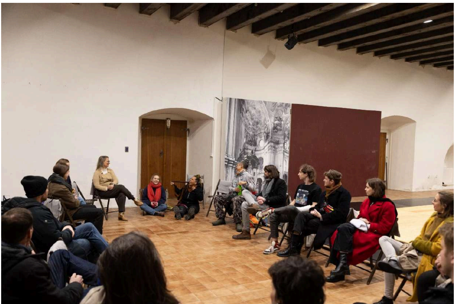
Tvůrčí a výzkumné rezidence ART KLASTR I., diskuse s diváky