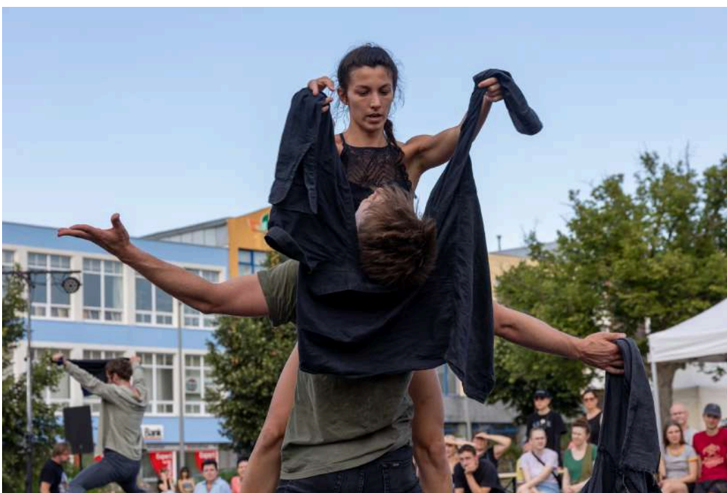
Asuelto, skupina HURyCAN, náměstí Republiky, Žďár