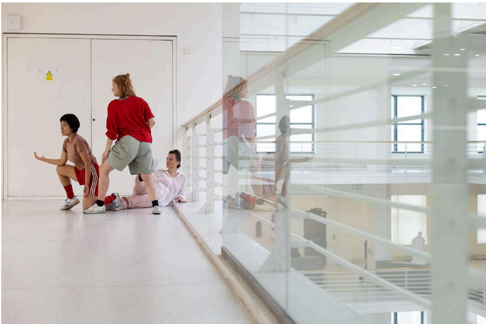
Tanec v galerii 2024: Museography Choreography v choreografii Alice Chauchat

(Cíle, přehled realizovaných aktivit, účetní uzávěrka)