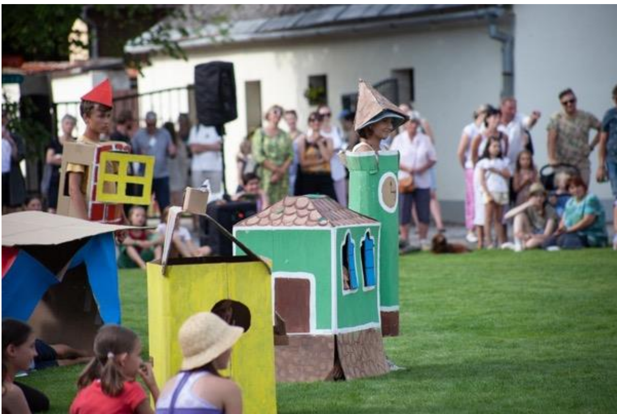
Představení dětí z Tvořivého tábora KoresponDance