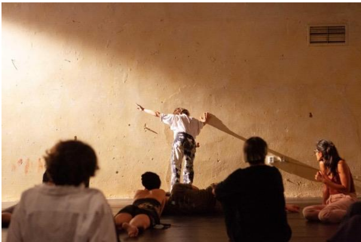
Rezidence pro choreografy s uměleckým koučinkem 2023, foto: Julie Stehnová