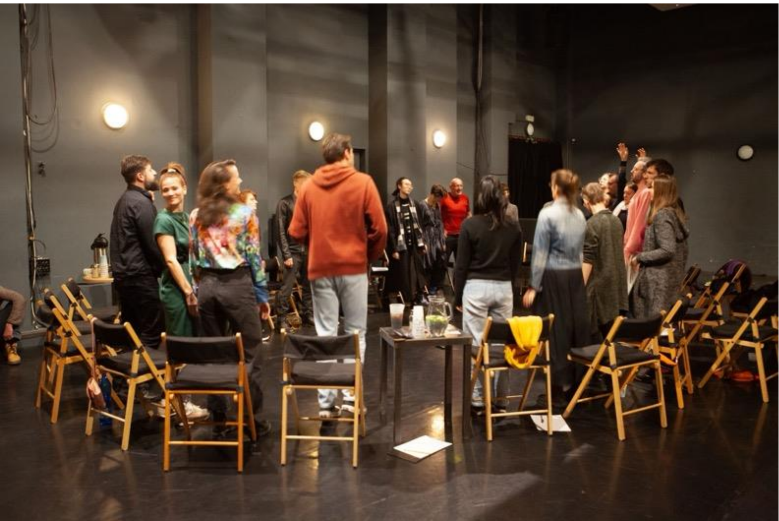
Choreografické café 2023

Rezidence italských a českých tanečníků/choreografů projektu BelInternational na zámku Žďár – nebylo součástí NPO, ani MKČR