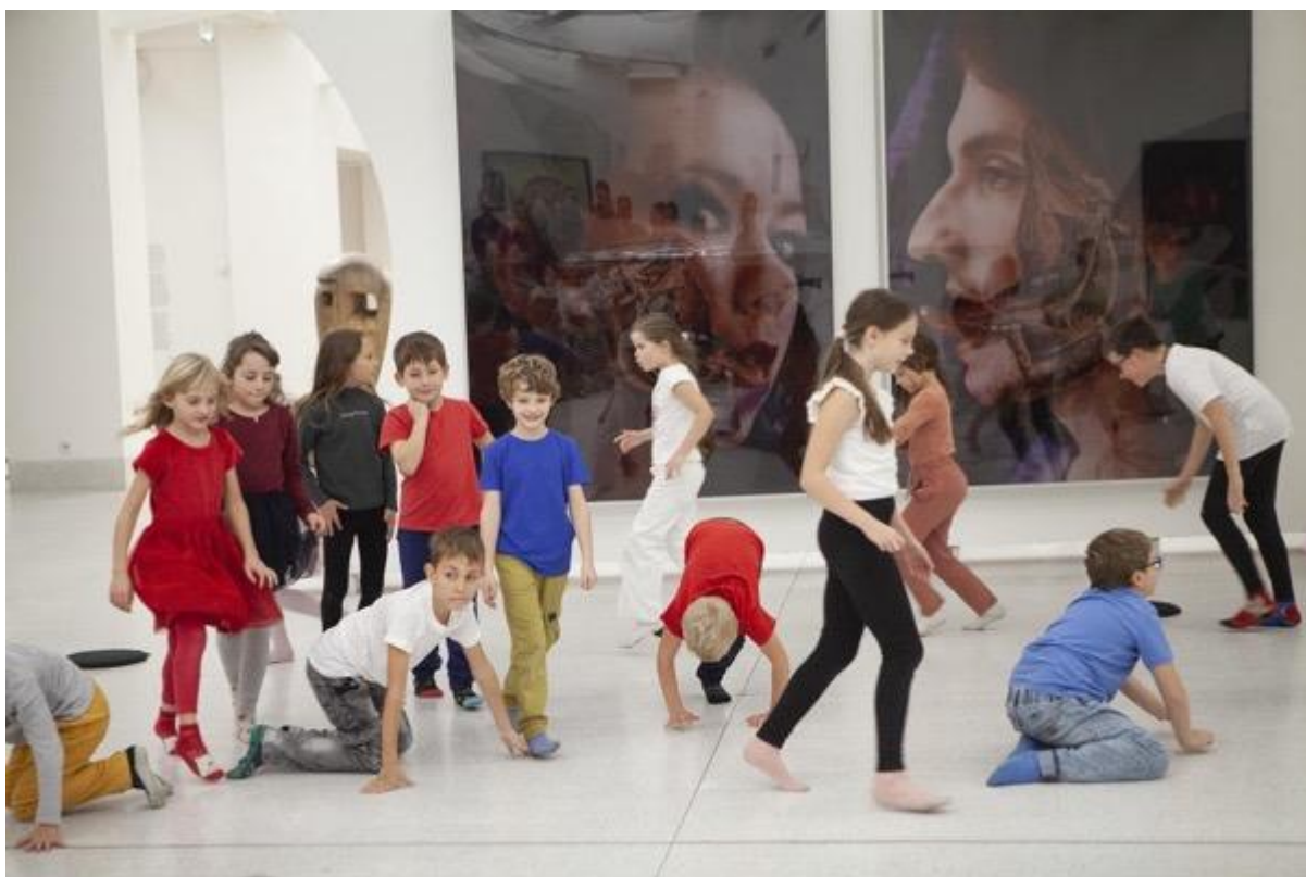
ZŠ Solidarita v Národní galerii v rámci projektu Škola tančí, foto: Dragan Dragin