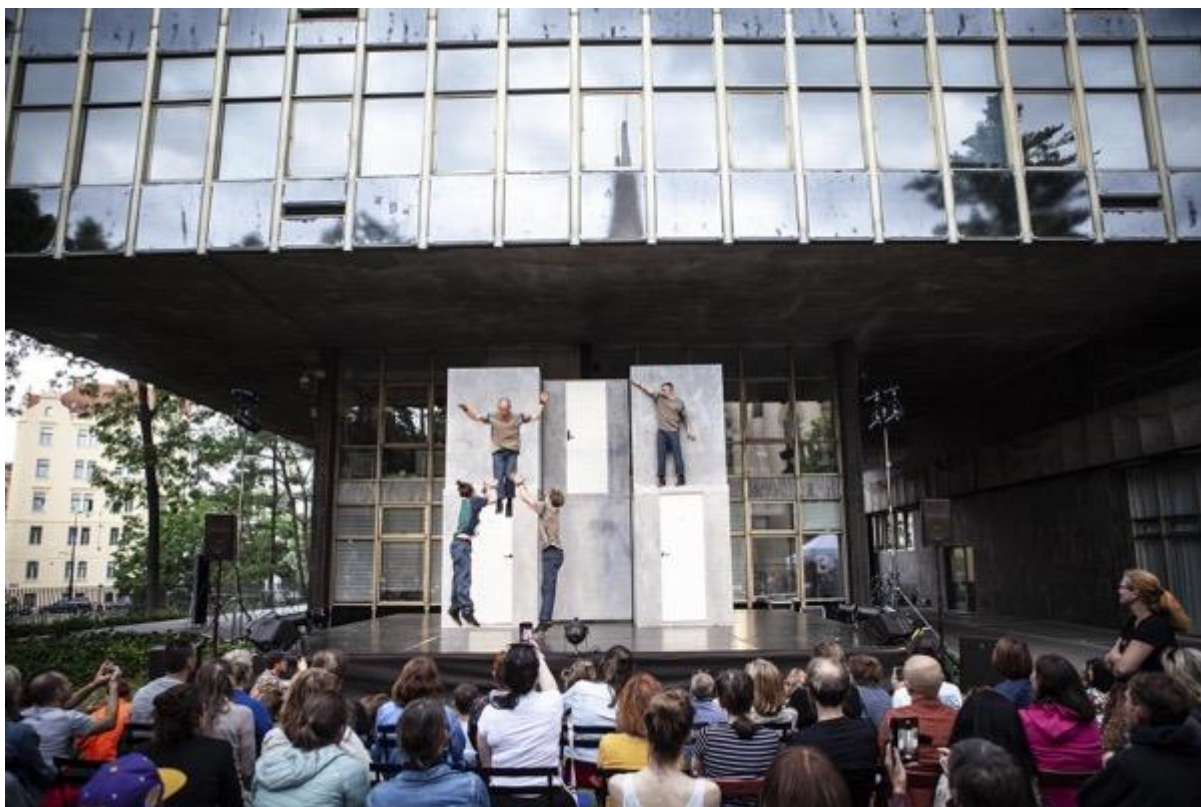
KoresponDance Praha 2023, Circumstance: EXIT