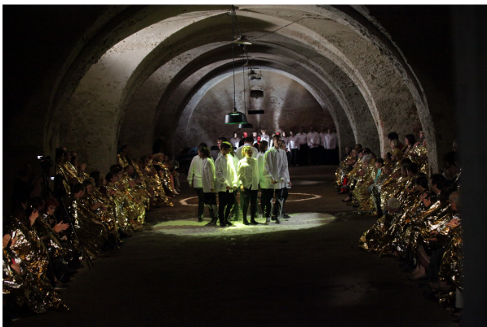
Premiéra představení Everything is nice in Paradise, KoresponDance 2017