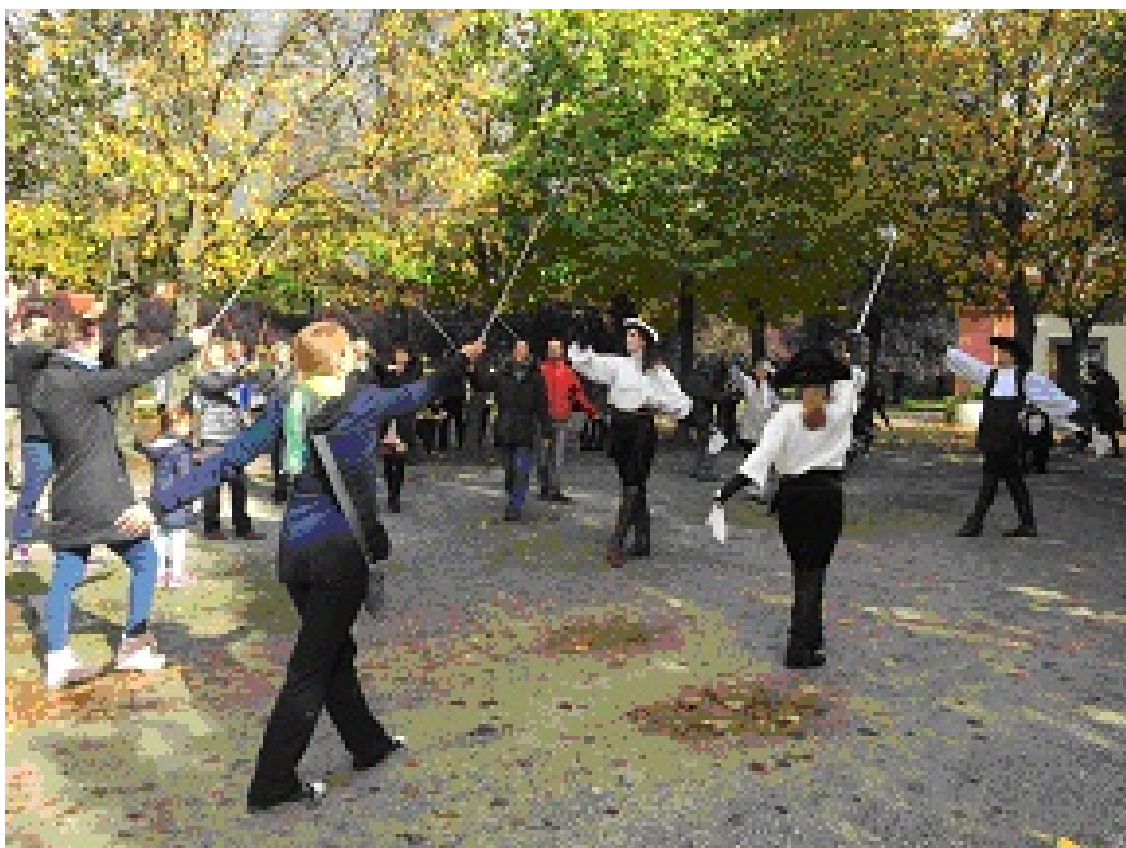
Barokní promenáda, uvedení 8.10.2017