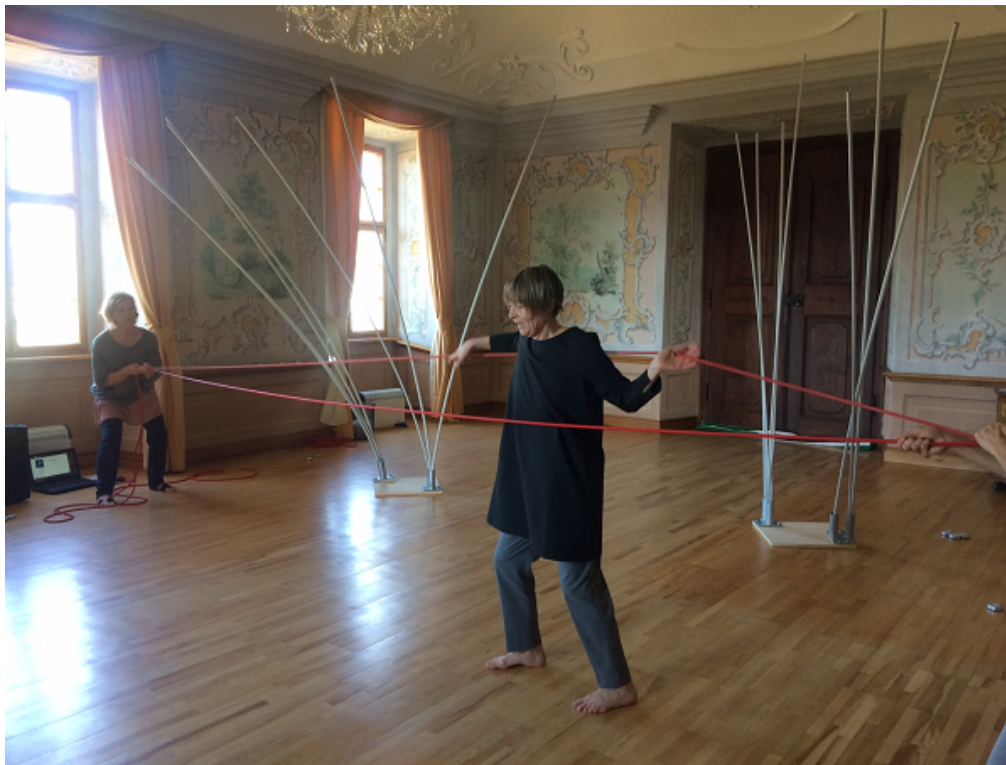
Prezentace work in progress projektu Be-coming, Žďár nad Sázavou

Finální fáze příprav představení Be-coming strávily tanečnice v jiných rezidenčních prostorech, vzhledem k nutnosti příprav světelného designu. Premiéra představení proběhla 22. dubna v rámci festivalu NUDANCEFEST v Bratislavě.