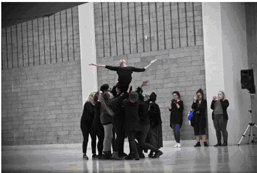
Pohybově-vizuální instalace Secret Journey, uvedení 14.10.2017