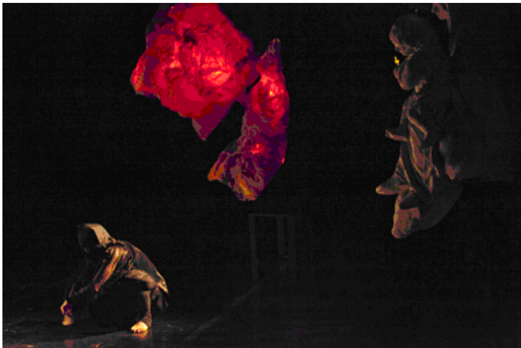
Taneční instalace Studies and Fragments of Dreams v Muzeu Nové generace, Žďár n/S, 8.7.2017

Taneční instalace zhlédlo na 250 diváků z nichž většinu tvořili obyvatelé kraje Vysočina.