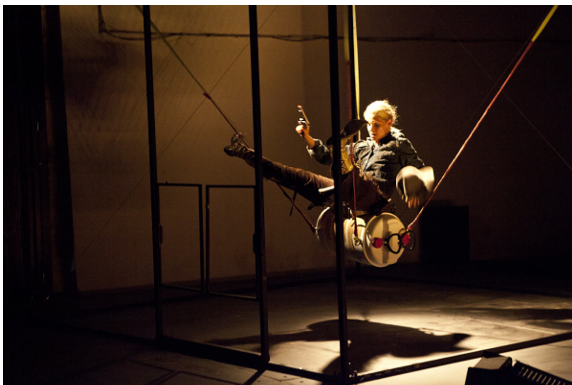
Premiéra představení Heroin West, KoresponDance 2017

Vytvořeno ve staré, stále rustikální jízdárně na žďárském zámku získalo toto představení na zvláštní atmosféře díky festivalu KoresponDance . Premiéru 9.7. a reprízu 10.7. velmi ocenilo kolem 250 diváků.