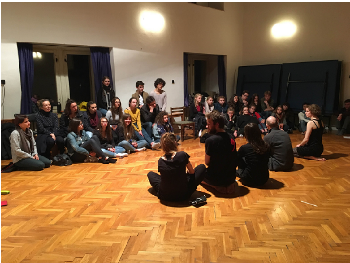
Prezentace work in progress, ZDRUHESTRANY, Žďár nad Sázavou