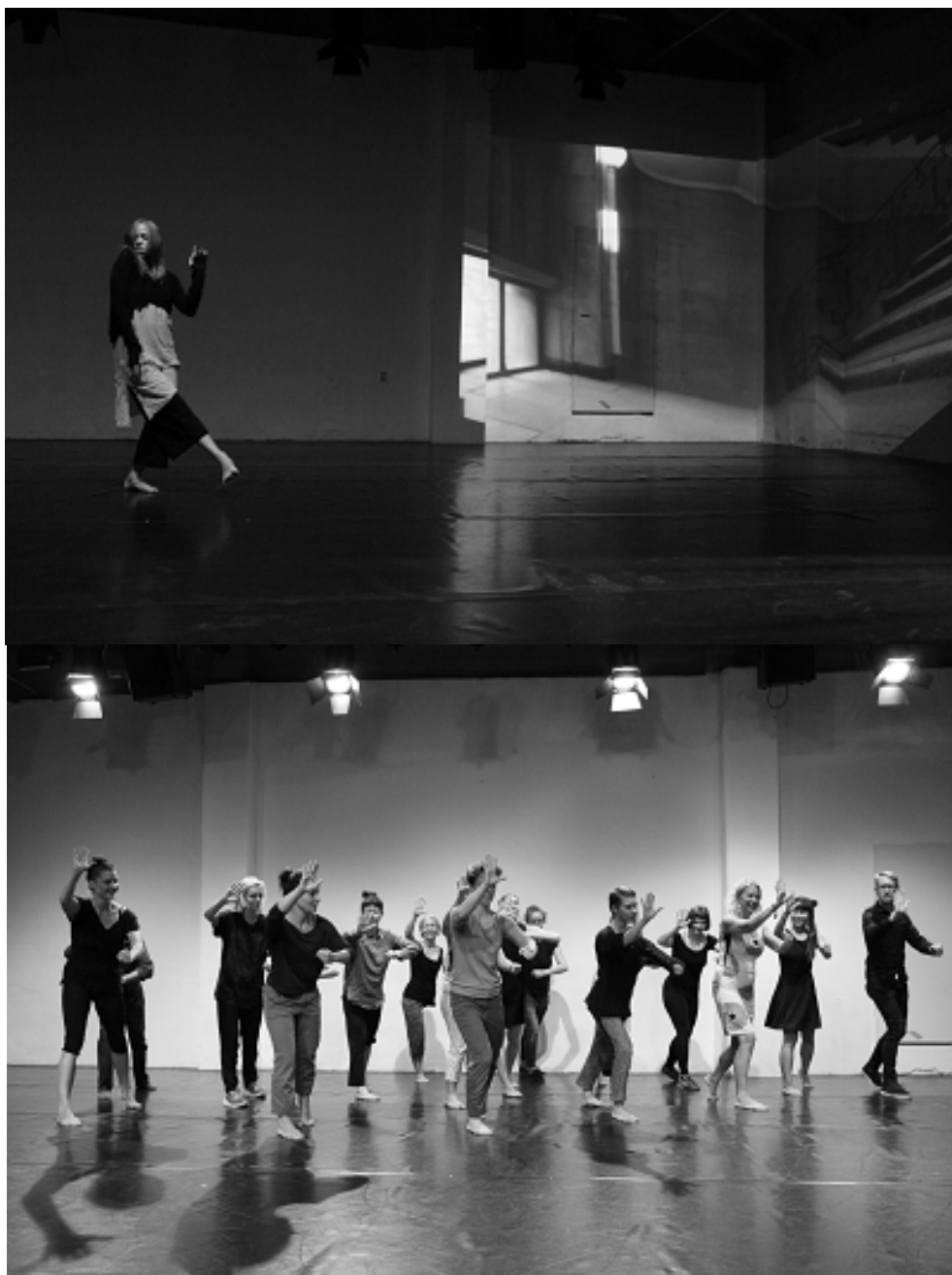
Závěrečná prezentace výsledků „work in progress“, Studio ALTA 24.8.2017

Nizozemí). Konceptem Rezidence s koučinkem se inspirovala univerzita v Toulouse a v Nice , které mají díky novým způsobům výuky velmi kladné odezvy. Koncept Rezidence s koučinkem se již dostává do povědomí evropské odborné veřejnosti i díky prezentaci v rámci kulatých stolů o inovativních způsobech tvorby v divadle de Chaillot a v Národním centru tance v Paříži .