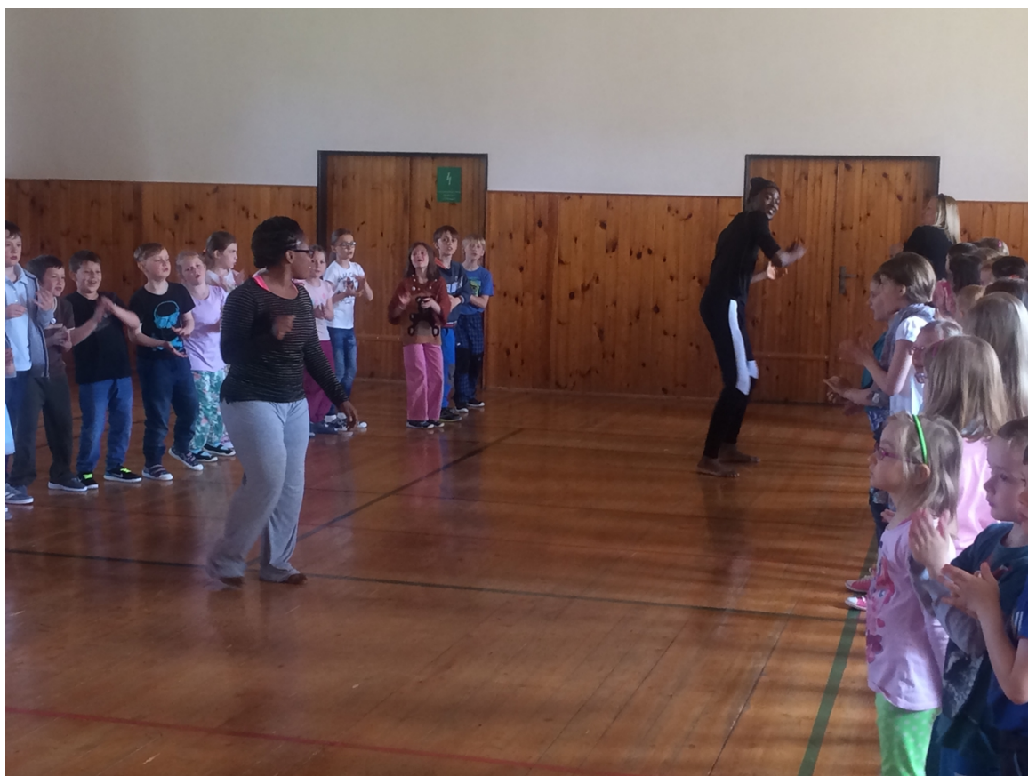
Workshop pro děti, Ghana zrána, Žďár nad Sázavou