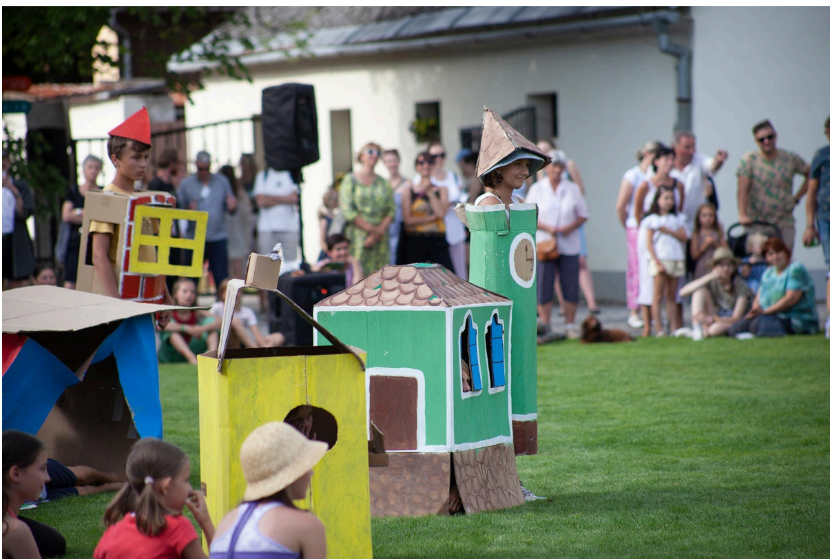
Představení dětí z Tvořivého tábora Korespondance